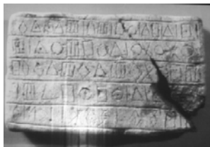
تصویر ۱: کتیبه کوچک یافت شده در جیرفت، ۲۴۵۰-۲۴۰۰ سال ق.م. (مربوط به کنگره جیرفت) (۴)

یکی از مهم‌ترین پایه‌ها و نیازهای علمی هر تمدنی خط می‌باشد. پیدایش خط در هر جامعه‌ای نقطه آغازی برای شروع علم‌آموزی بوده و بدون آن پیدایش مکاتب علمی بدون را نمی‌توان تصور نمود. در ایران، مطابق آخرین یافته‌های باستان شناسی در ناحیه جیرفت، پیدایش خط مربوط به حدود ۲۵۰۰-۲۴۰۰ سال پیش از میلاد مسیح است (تصویر ۱).