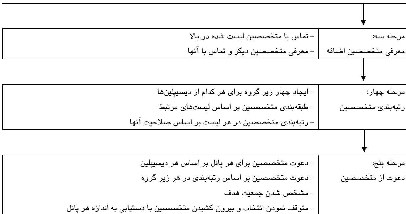
شکل ۱: پروسیجر انتخاب متخصصین در یک مطالعه دلفی

موضوع خاص هدف باشد، سؤالات متمرکز و دارای ساختار استفاده می‌گردد (۳۶ و ۷).