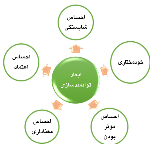
شکل ۱- پنج بعد کلیدی توانمندسازی کارکنان

(سواد اطلاعات و ارتباطات مجازی، سواد رسانه‌ای و...) ۳- مهارت‌های قرن بیست و یکم (تفکر انتقادی، حل مسئله و چابکی) (۹). توانمندسازی نیروی انسانی در سازمان‌های آموزشی به لحاظ نقش مهمی که در توسعه و پیشرفت جامعه در ابعاد متعدد دارد، از اهمیت بیشتری برخوردار است. بنابراین لازم است که دانشگاه‌ها با توجه به شرایط و مقتضیات خود، ساز و کارهای مناسب جهت توانمندسازی اعضای هیأت علمی شناسایی و کلیه امکانات را برای آن بسیج نمایند (۱۰). در یکی از بهترین مطالعات تجربی انجام شده در زمینه توانمندسازی تا به امروز، که توسط دانشمندانی چون توماس و ولتهوس (Wolthaus & Thomas)، صورت گرفته است (۱۱)، پنج بعد کلیدی توانمندسازی کارکنان شناسایی شده است (شکل ۱). برای این که مدیران بتوانند دیگران را با موفقیت توانمند سازند، باید این پنج ویژگی را در آنان ایجاد کنند.