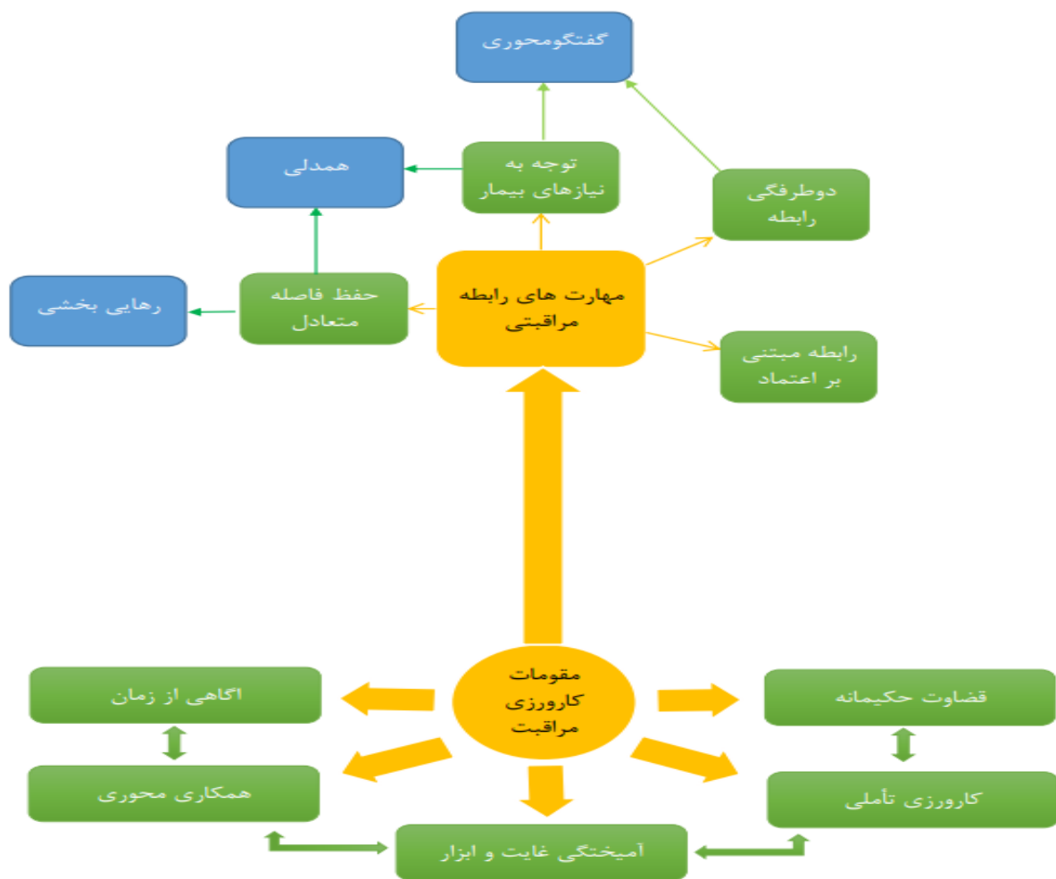
شکل ۲: مدل فرونتیک مراقبت

همچنین، مراقبت‌کننده برای آن که بتواند با بیمار همدلی کند، باید فهمی از بیمار و قضاوتی حکیمانه درباره شرایط او پیدا کند و برای چنین قضاوتی نیازمند تأمل درباره کارورزی خود و ارزیابی عملکرد خود در موقعیت‌های مختلف و اصلاح خطاهای پیشین است. ترکیبی از قضاوت، تأمل و