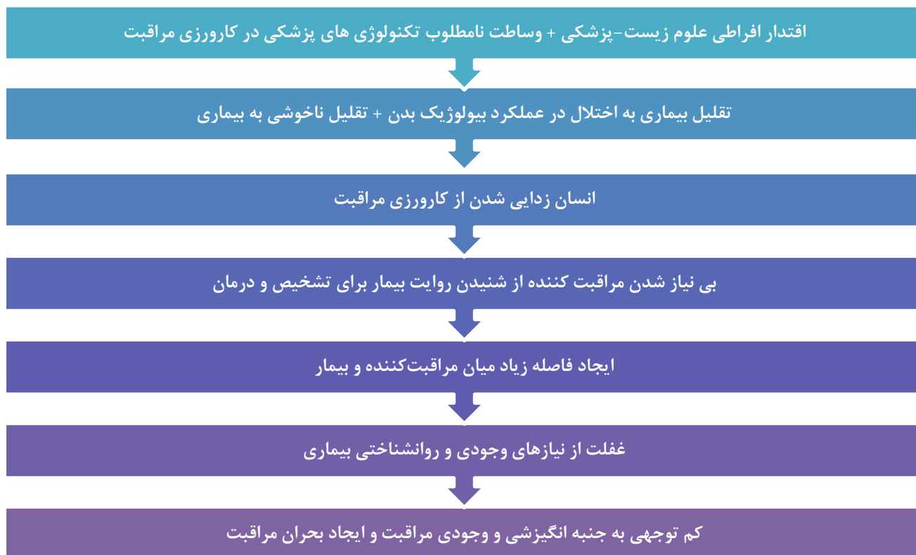
شکل ۱: زنجیره علل به وجود آمدن بحران مراقبت کننده

آن، باید درباره کارورزی پزشکی و نقش مراقبت در آن به نحوی انتقادی تأمل کرد. بنابراین، مراقبت‌کنندگان برای آن که قادر باشند کارورزی خود را به نحوی مؤثر و مطلوب انجام دهند، ناگزیرند از این که بحران مراقبت را به رسمیت بشناسند و با وجوه و علل گوناگون آن آشنا شوند. چرا که این بحران، مانعی انکارناپذیر در جهت دستیابی به غایت کارورزی مراقبت سلامت، یعنی مراقبت از بیمار در جهت کاهش رنج و ناخوشی اوست. از آنجایی که علت اصلی بحران مراقبت، مخدوش شدن رابطه مراقبتی میان مراقبت‌کننده و مراقبت شونده است، مراقبت‌کنندگان باید دانش و مهارت‌های لازم را برای شکل دادن به یک رابطه