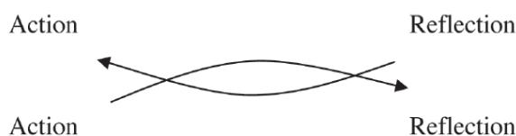
تصویر ۴: دیالکتیک پراکسیس

عنوان یک پراکسیس نیز به صورت پیوند بین تئوری و عمل توصیف می‌شود که بیان‌گر تلفیق فرایندهای عملکرد و تحقیق است یا همان طور که هاجز بیان می‌کند «تلفیق تئوری و عملکرد، تلفیق تحقیق و عملکرد» است (۸). اوبرین می‌گوید «در یک فرایند پیش‌رونده، دانشی که از عملکرد ناشی می‌شود و عملی که به وسیله دانش هدایت می‌شود، نقطه اتکای اقدام‌پژوهی است» (۷ و ۸). ناروئمون می‌نویسد پراکسیس اساساً به یک حرکت عقلانی، عاطفی و عملی اشاره می‌کند. در حقیقت پراکسیس یک دیالکتیک است که به طور اولیه در رویکرد اقدام‌پژوهی مشارکتی (PAR) توسعه یافته است. او این دیالکتیک را به شکل زیر نشان می‌دهد (۱۱).