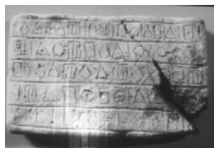
تصویر ۱: کتیبه کوچک یافت شده در جیرفت، ۲۴۵۰-۲۴۰۰ سال ق.م. (مربوط به کنگره جیرفت) (۴)

یکی از مهم‌ترین پایه‌ها و نیازهای علمی هر تمدنی خط می‌باشد. پیدایش خط در هر جامعه‌ای نقطه آغازی برای شروع علم‌آموزی بوده و بدون آن پیدایش مکاتب علمی بدون را نمی‌توان تصور نمود. در ایران، مطابق آخرین یافته‌های باستان شناسی در ناحیه جیرفت، پیدایش خط مربوط به حدود ۲۵۰۰-۲۴۰۰ سال پیش از میلاد مسیح است (تصویر ۱).