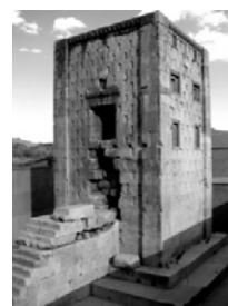
تصویر ۴: کعبه زرتشت، واقع در نقش رستم (مرودشت)

امروزه در بین محققین نظریه‌های متفاوتی درباره کارکرد عمارت مشهور به کعبه زرتشت (تصویر ۴) در نقش رستم (واقع در استان فارس) وجود دارد، یکی از نظریه‌های موجود نسبت به آن چنین است: کعبه زرتشت را گشتاسب به اشاره زرتشت بنا نهاد و در آن احکام زرتشت بر روی پوست گاو نگهداری می‌شد. نوشته‌های روی پوست‌های دباغی شده گاو شامل اطلاعات ارزشمند علمی، پزشکی و دامپزشکی نیز می‌شده که متأسفانه مقدار اندکی از آن اطلاعات باقی مانده است. این مجموعه می‌توانسته به عنوان بخشی از دانشگاه پارسه عملکرد کتابخانه‌ای داشته باشد (۱۸).