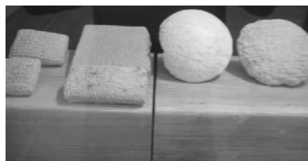
تصویر ۲: نمونه‌ای از الواح یافته شده در شوش، دوره هخامنشی، موزه شوش

ابداع می‌شود (۱۰). همچنین در این دوران خطوط آرامی و عیلامی نیز در سیستم دیوانی و اداری دولت ایران کاربرد بسیار یافته و الواح بسیاری به این زبان‌ها یافت شده است (تصویر ۲).