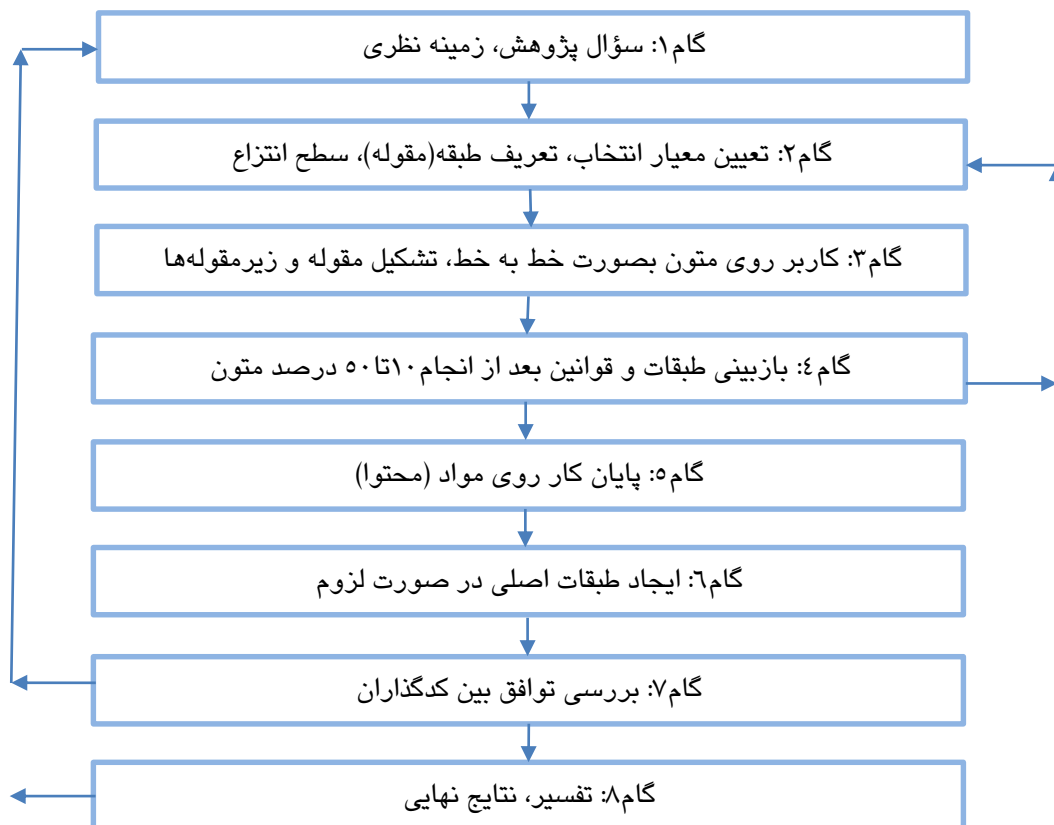
نمودار ۲. مراحل توسعه مقوله استقرایی مایرینگ (۲۰۱۴)

مشخص اشاره دارد. در نهایت تم یا مضمون شکل می‌گیرد. سطوح انتزاع از کد به سمت مضمون افزایش می‌یابد. در مرحله کدبندی، همراه با مرورگر دوم، با مطالعه دقیق، بازبینی و خلاصه‌نویسی، انجام شد. بدین ترتیب مقوله و زیرمقوله‌ها مشخص و الگوی مفهومی ترسیم شد که در