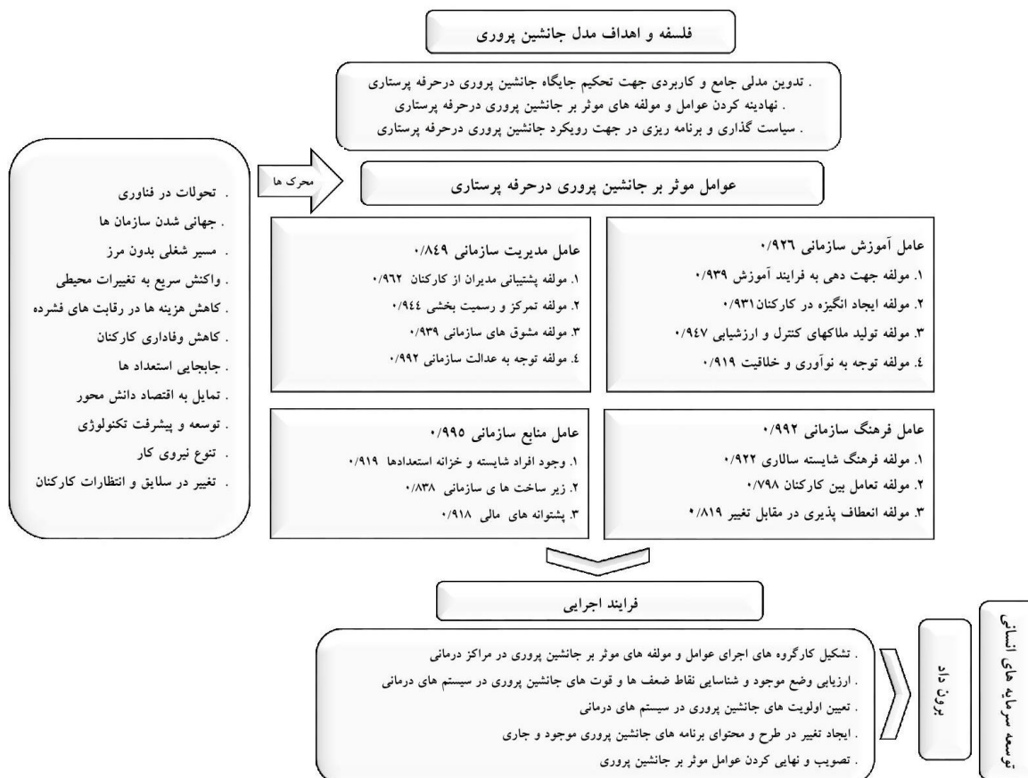
شکل ۲. الگوی نهایی توسعه سرمایه انسانی با تکیه بر رویکرد جانشین پروری در پرستاران

هر سازه ( >0/7 ) و بار عاملی ( >0/4 ) پایایی الگوی نهایی تایید شد.